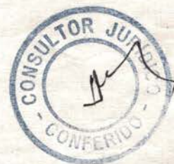
LUIZ TADEU LEITE Prefeito Municipal