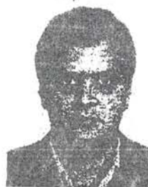
AÉCIO NEVES (Aécio Neves da Cunha)