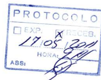
Luiz Tadeu Leite Prefeito Municipal