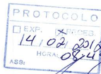
Luiz Tadeu Leite Prefeito Municipal

Montes Claros-MG, 13 de fevereiro de 2012.