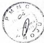
Luiz Tadeu Leite Prefeito Municipal