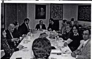
Reunião da Comissão Organizadora do Troféu 2009 / 2010